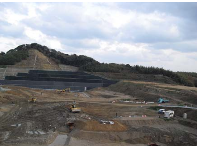
写真（上）：研修会 写真（下）：西部（中田）埋立場

底部集排水管及びガス抜き管を適切に管理し、浸出水の排水及び処分場内の通気性を確保することが重要であること、それにより好気性分解が促進され、水処理など維持管理コストの低減化につながっていることが説明されました。