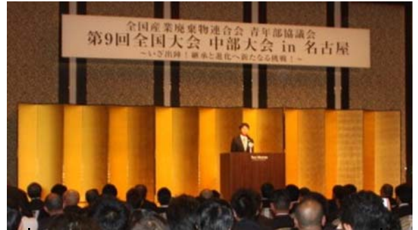
写真(上)：挨拶する加山青年部協議会会長 写真(下)：全国大会のもよう