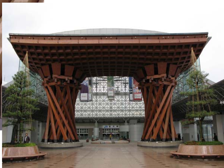
大断面集成材（石川県）