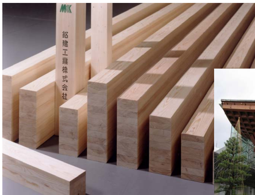
一般住宅構造用集成材